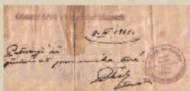
Protektorátní dvojjazyčné razítko Obecního úřadu Horní Měcholupy z roku 1941