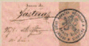
Razítko Obecního úřadu Horních Měcholup z roku 1891