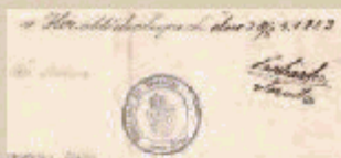
Razítko Obecního úřadu Horní Měcholupy z roku 1923